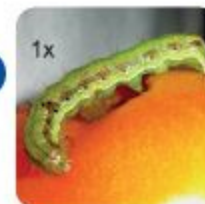
1x Ulat Pengorek Buah 蛀果虫