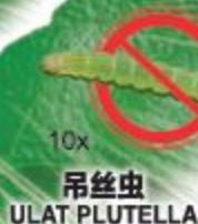
10x ULAT PLUTELLA 吊丝虫