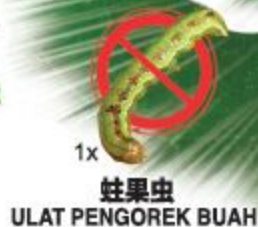
1x Ulat Pengorek Buah 蛀果虫