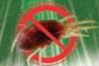
30x HAMA MERAH 紅蜘蛛